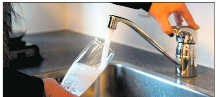
Vandforsyningen i Lejre Kommunes største by skal fremtidssikres, lyder meldingen fra det lokale vandværks bestyrelse.

Kontakt Roskilde Hørecenter, og prøv det unikke høreapparat fra Signia.